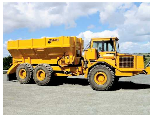
ETS 215 VOLVO A25C