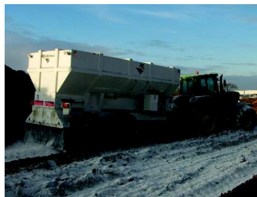
ETS 215 sur remorque double essieu